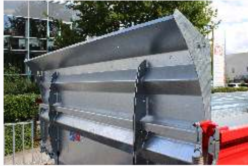
Schippe (Bordwanderhöhung vorn)