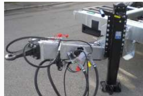
2 Gang Stützfuß