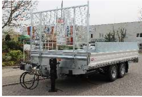
H-Gestell mit Gitter