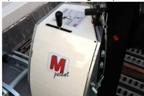
E-Hydraulik inkl. Funk