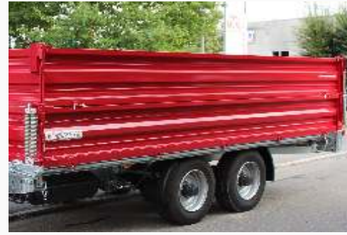
Alu-Aufsätze / Stahl-Aufsätze