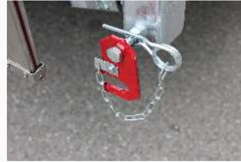
Verriegelung für abgeklappte Bordwand